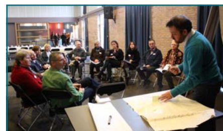
Le Centre de Compétences Tourisme du FOREM a animé la journée rencontre du 10 janvier

L'autre événement marquant du début de l'année 2011 fut la journée de travail qui a rassemblé une cinquantaine d'acteurs touristiques du territoire. Cette initiative nous a permis de poser les bases d'une future mise en réseau de nos partenaires locaux.