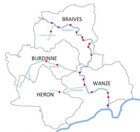
● Anciens moulins hydrauliques

Enfin, au cours des prochains mois, des projets d'aménagements pédagogiques dédiés aux énergies renouvelables verront le jour. Ainsi, une rencontre a déjà eu lieu avec les responsables du projet de vis hydro-dynamique sur le site du Val Notre Dame à Antheit afin d'envisager les aménagements didactiques de mise en valeur de cet outil exceptionnel.