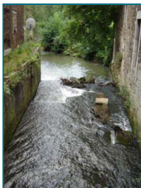
Site du Val Notre-Dame

Le but est ici d'identifier des porteurs de projets afin de valoriser des recherches et réalisations centrées sur la production d' énergie renouvelable . Trois axes de travail sont privilégiés :