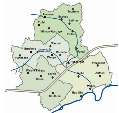
4 communes et 24 villages forment le territoire du GAL Burdinale Mehaigne